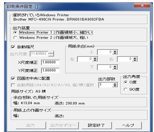
印刷条件設定画面